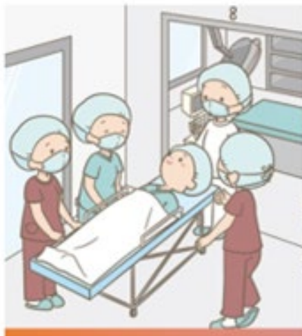
手術看護・周術期看護