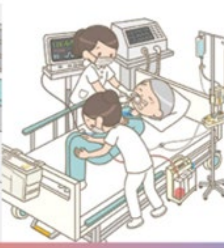
クリティカルケア看護