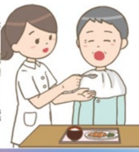
嚥下障害を伴う患者への食事介助