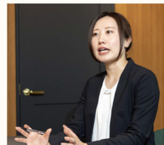
カウンセリングの様子